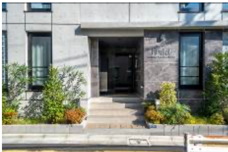
Hmlet 新宿若松町エントランス

この大崎電気との革新的なスマートロック化プロジェクトにより、ハムレットは入居者に非対面での安全な生活を提供し、運用フローを効率化し、入退去プロセスの利便性を向上させています。